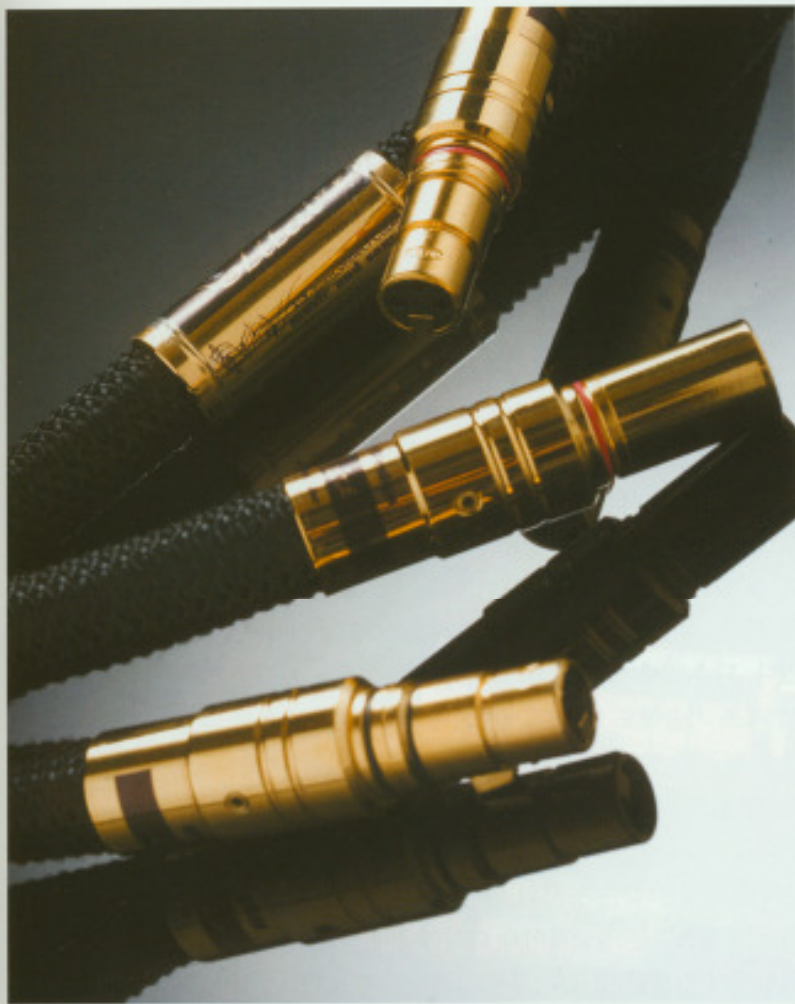
수입원 : 인베스트코리아 (031)932-0606 · 가격 : 1,000만원

이렇듯 오랜 역사를 바탕으로 개발된 솔리테어 밸런스 케이블, 동사의 최고급 기종으로서 차별화된 기술적 내용들을 담고 있다. 이에 대한 간단한 내용들을 소개하면, 먼저 무산소 구리 하이퍼 와이어에 은도금 처리를 한 선재를 채택했다. 여기서 눈길을 끄는 것은 금도금 케이블을 사용하지 않는 HB사의 입장인데, 기본적으로 고주파수를 억제하는 성향상 은도금을 활용하며, 금의 경우 전기적 접점을 향상시키기 위해 일부 연결 부위에만 사용했다고 한다. 정확한 근거 데이터는 확보할 수 없는 실정이지만, 자신들의 경험과 연구 개발 결과를 적절히 제품에 투입한 메이커 측의 설계 사상을 엿볼 수 있는 대목이다. 정확한 소재의 비밀은 비공개 원칙을 갖고 있는 메이커의 특성상 더 이상 설명이 불가능하며, 내부의 와이어에 완벽한 공기 절연 방식의 채택과 실딩 소재로 동과 알루미늄 호일로 구성된 특수 형태의 복잡한 구조를 채택했다. 외부 실딩에는 추가로 폴리이미드 단섬유와 동선이 사용되었으며, 커넥터는 뉴트릭 사의 최상급 특수품을 사용했다. 이렇게 완성된 이 제품은 상당한 두께와 더불어 고급스